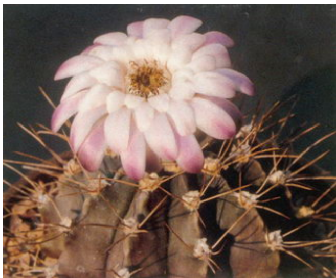
Figure 12 : Gymnocalycium anisitsii , une forme à l'inhabituelle couleur marron

G. amerhauseri (Fig. 9) a été décrit par Hans Till en 1994 dans la publication du groupe autrichien précédemment mentionné, à partir de plantes trouvées dans la province de Cordoba par Helmut Amerhauser, en l'honneur duquel ce gymno a été baptisé.